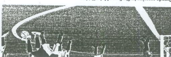
Grande agostino tra Sogliano e M. Ausiliatrice