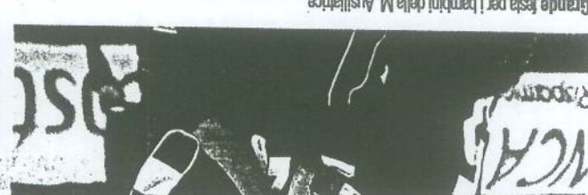
Grande festa per i bambini della M. Ausiliatrice